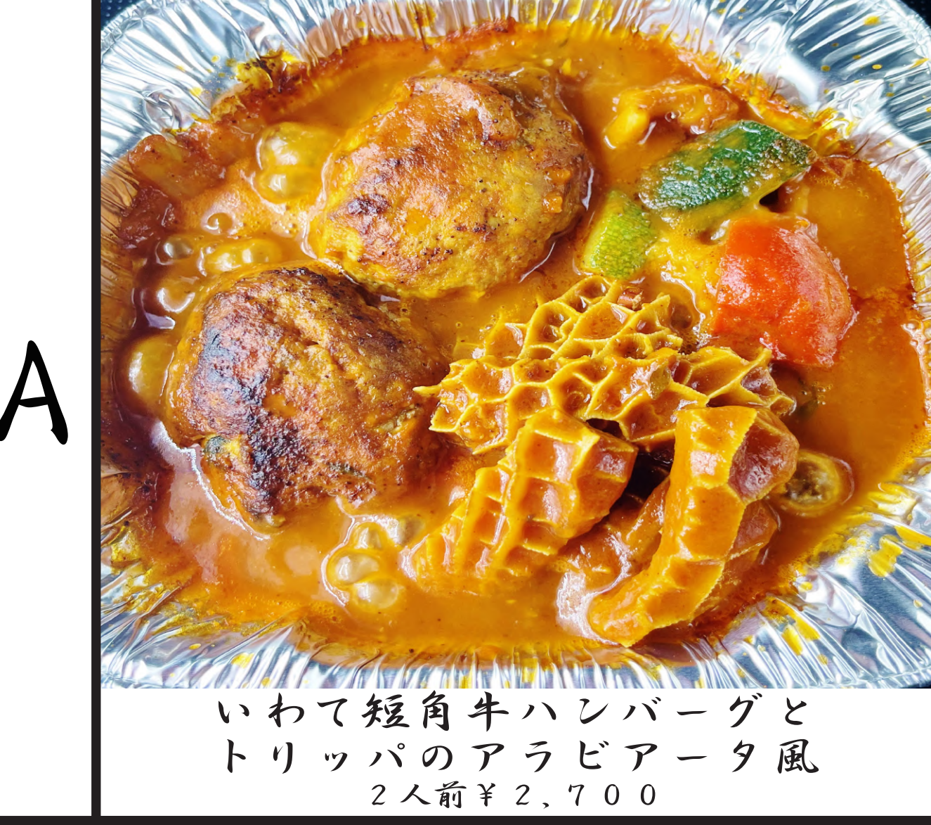
いわて短角牛ハンバーグと トリッパのアラビアータ風 2人前 ¥2,700