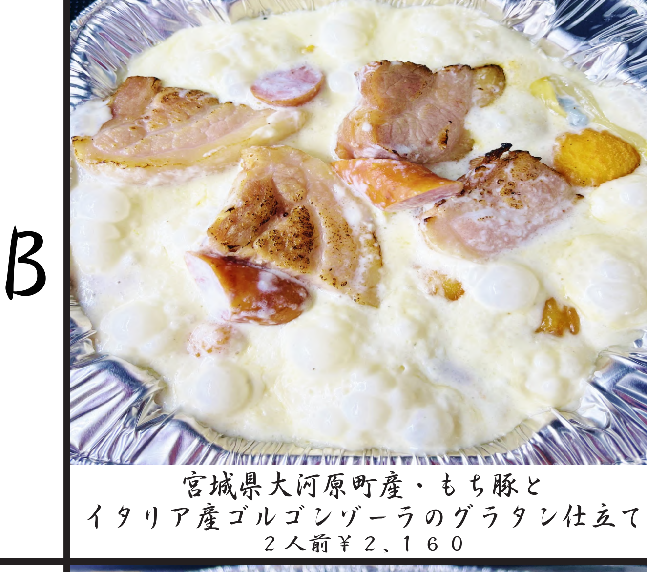
宮城県大河原町産・もち豚と イタリア産ゴルゴンゾーラのグラタン仕立て 2人前 ¥2,160