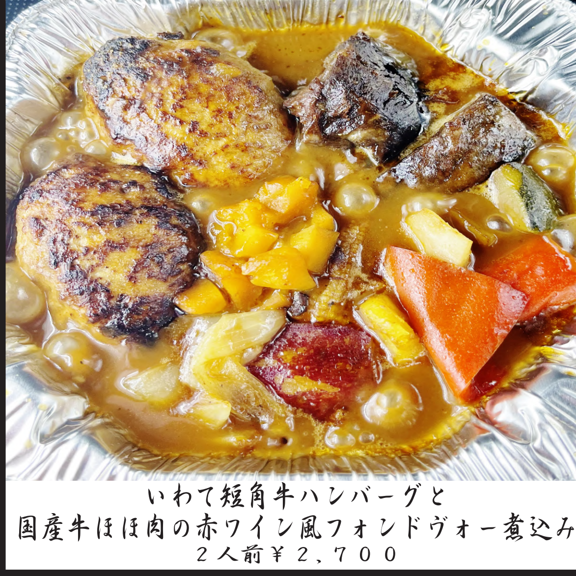
いわて短角牛ハンバーグと 国産牛ほほ肉の赤ワイン風フォンドヴォー煮込み 2人前 ¥2,700