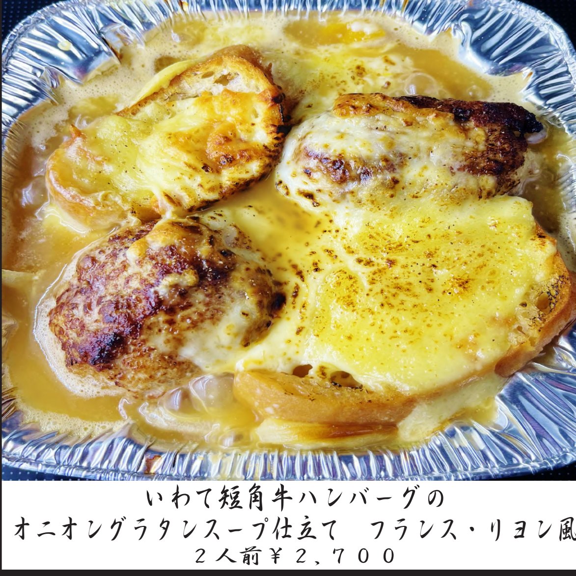
いわて短角牛ハンバーグの オニオングラタンスープ仕立て フランス・リヨン風 2人前 ¥2,700