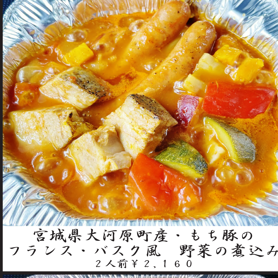
宮城県大河原町産・もち豚の フランス・バスク風 野菜の煮込み 2人前 ¥2,160