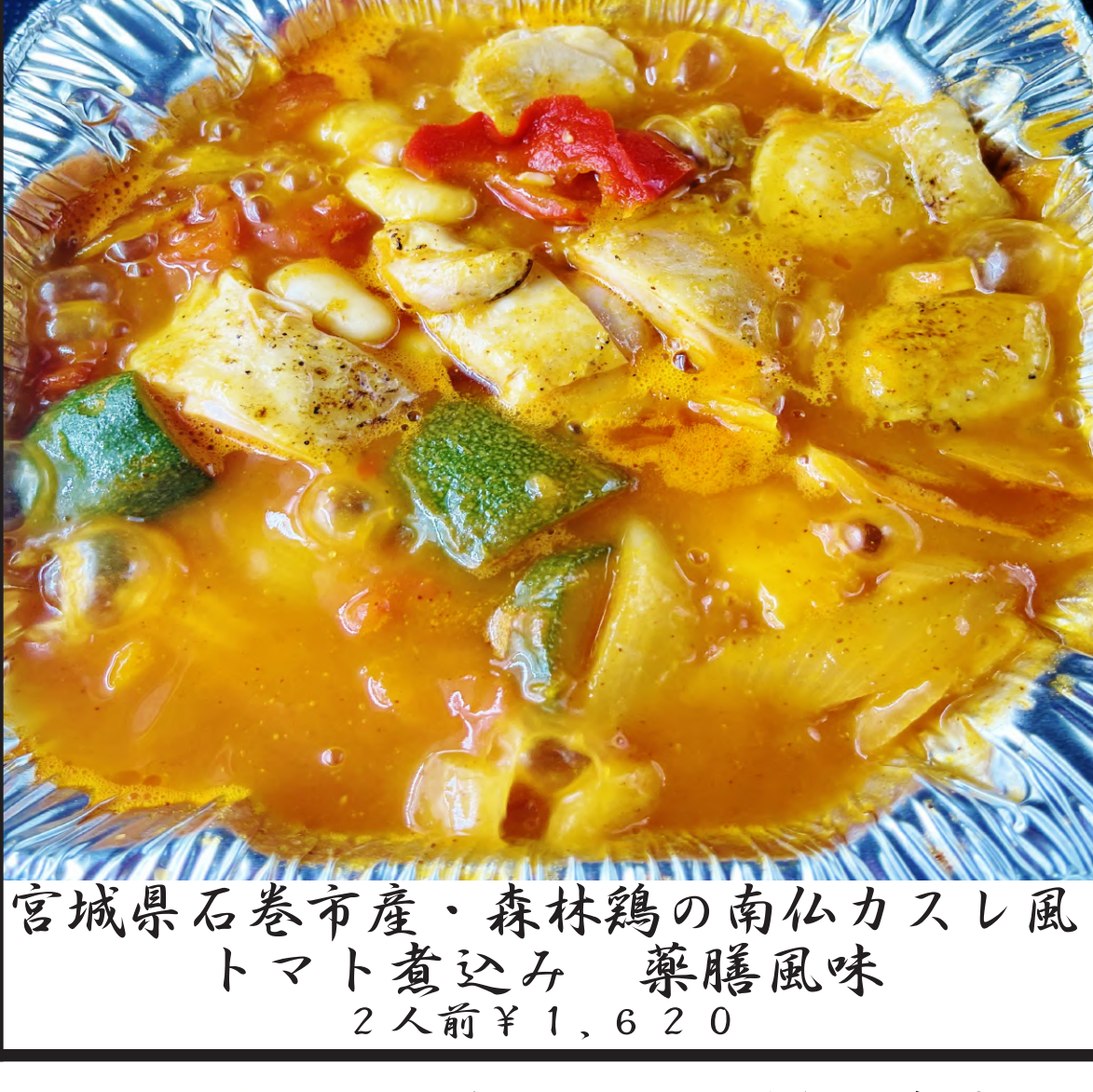
宮城県石巻市産・森林鶏の南仏カスレ風 トマト煮込み 薬膳風味 2人前 ¥1,620