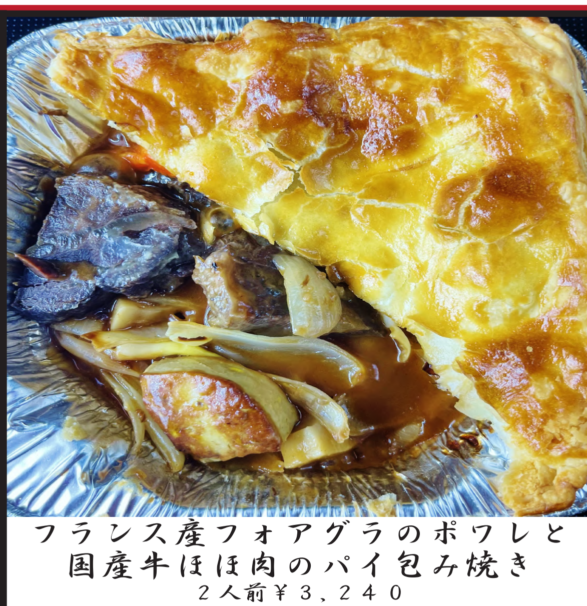
フランス産フォアグラのポワレと 国産牛ほほ肉のパイ包み焼き 2人前 ¥3,240