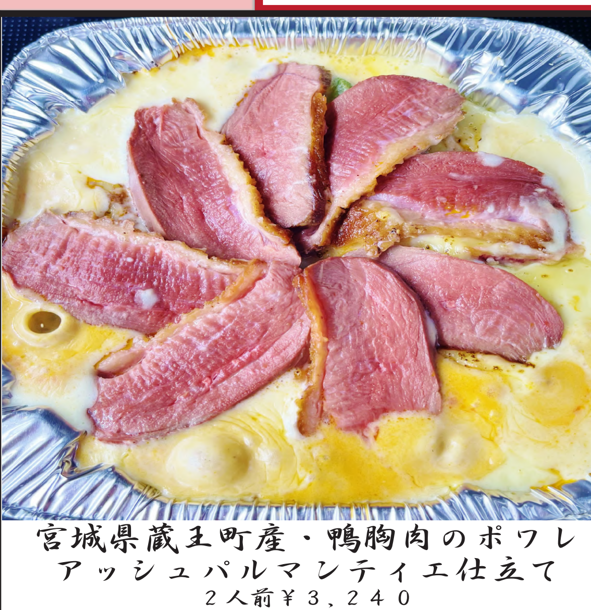
宮城県蔵王町産・鴨胸肉のポワレ アッシュパルマンティエ仕立て 2人前 ¥3,240