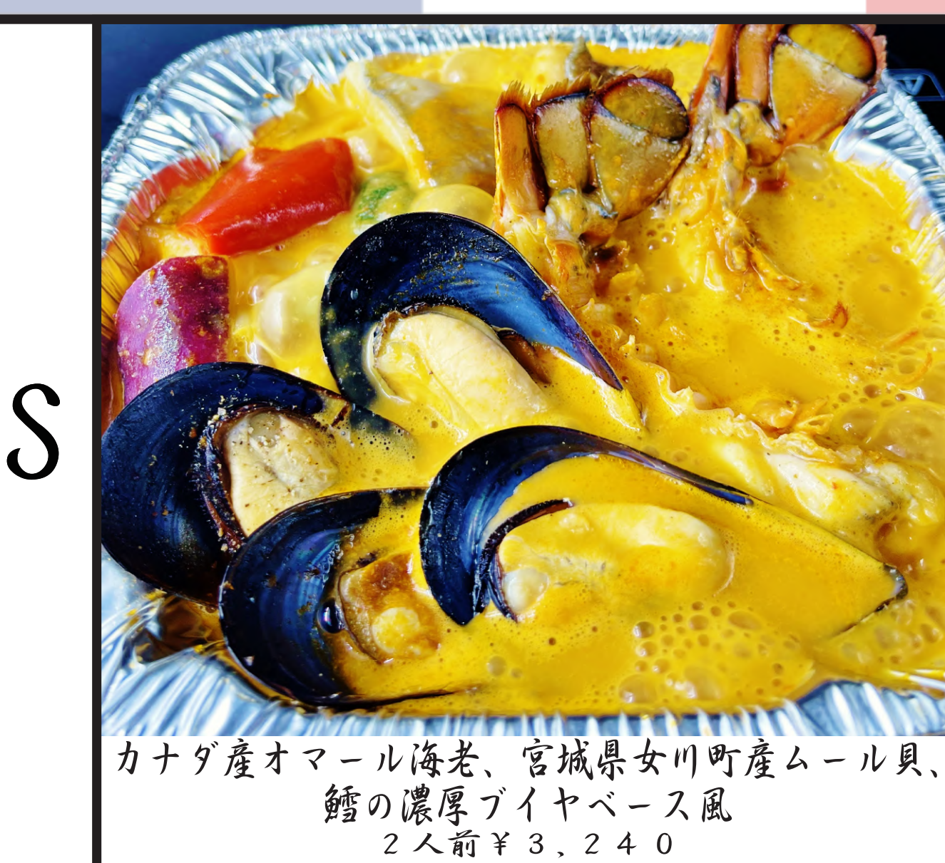
カナダ産オマール海老、宮城県女川町産ムール貝、 鱈の濃厚グイヤベース風 2人前 ¥3,240