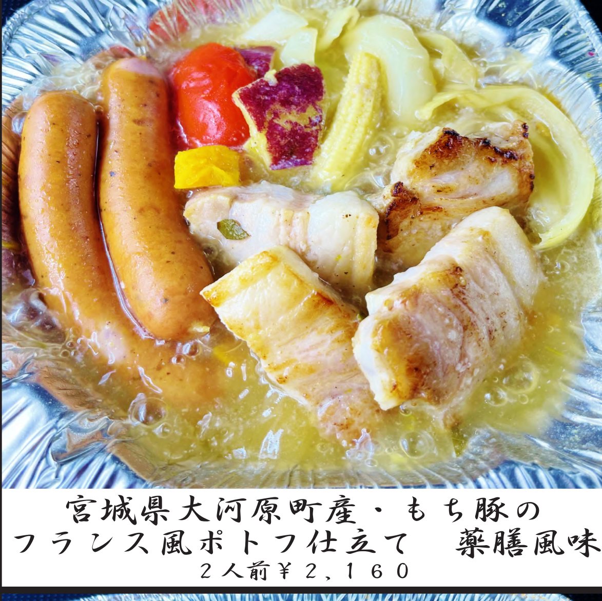
宮城県大河原町産・もち豚の フランス風ポトフ仕立て 薬膳風味 2人前 ¥2,160