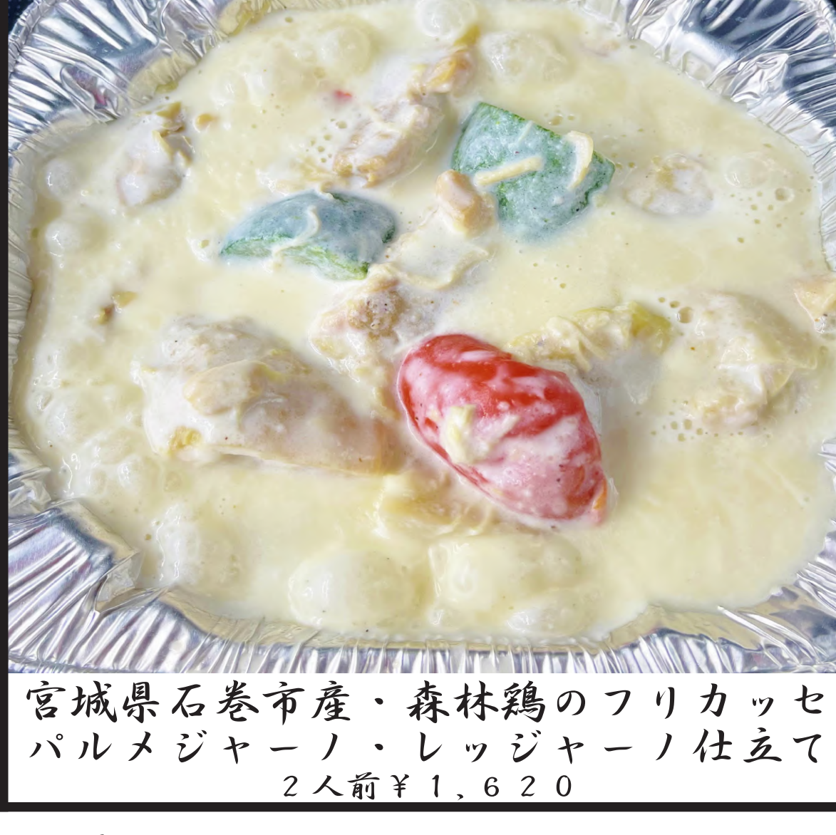
宮城県石巻市産・森林鶏のフリカッセ パルメジャーノ・レッチャーノ仕立て 2人前 ¥1,620